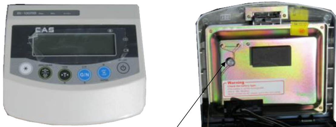
Индикатор CAS NT-200A