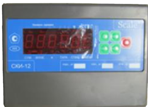
Схема пломбировки от несанкционированного доступа приведена на рисунке 2.