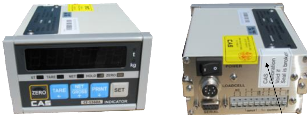
Индикатор CAS CI-200A

Место нанесения знака поверки в виде наклейки