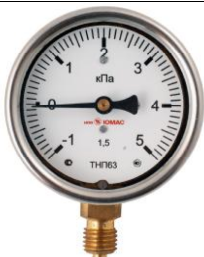
Рис. 7. Общий вид мановакуумметров показывающих ТНП