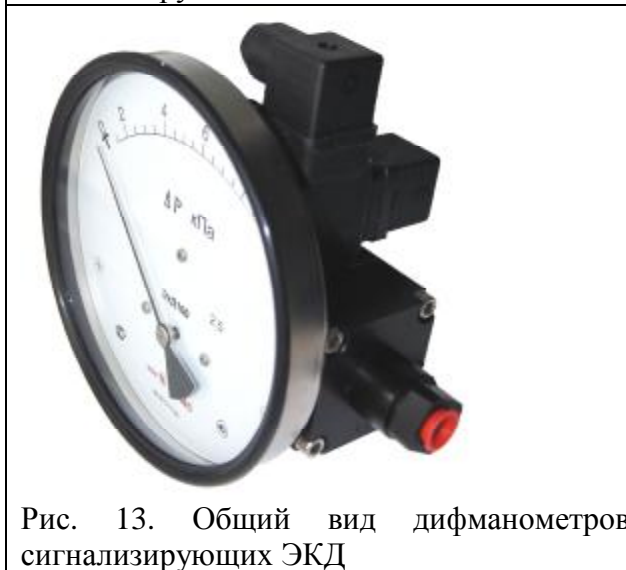
Рис. 13. Общий вид дифманометров сигнализирующих ЭКД