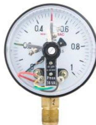
Рис 4. Общий вид манометров сигнализирующих ЭКМ