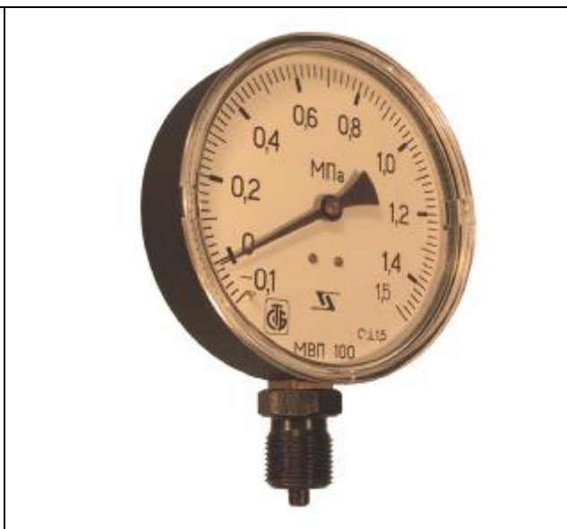
Рис. 10. Общий вид мановакуумметров показывающих МВП