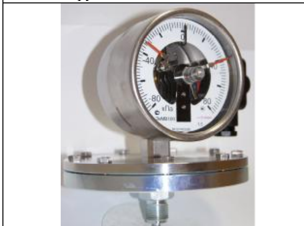
Рис. 11. Общий вид мановакуумметров сигнализирующих ЭКМВ