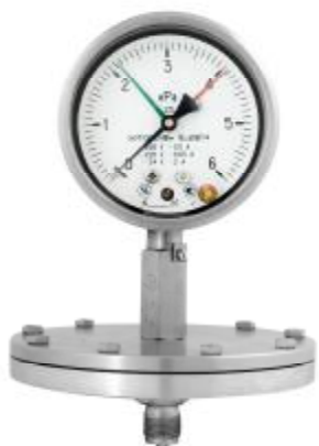
Рис 3. Общий вид манометров сигнализирующих ЭКН