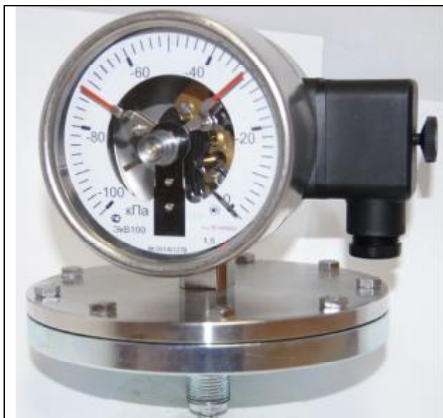
Рис. 9. Общий вид вакуумметров сигнализирующих ЭКВ