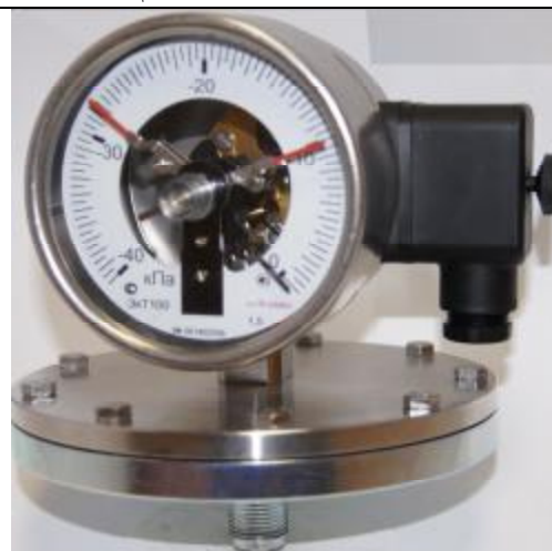
Рис 8. Общий вид вакуумметров сигнализирующих ЭКТ