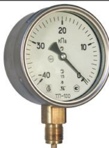
Рис 6. Общий вид вакуумметров показывающих ТП