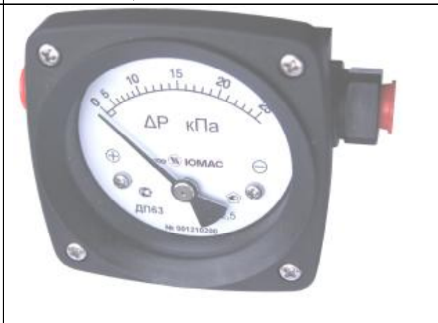
Рис. 12. Общий вид дифманометров показывающих ДП