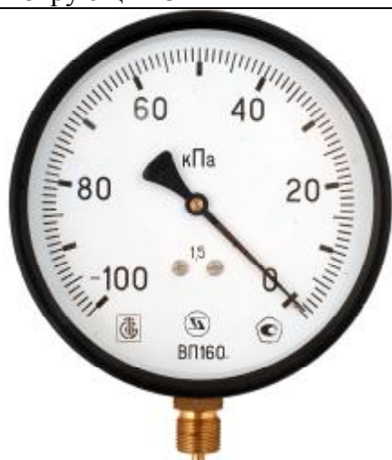
Рис 5. Общий вид вакуумметров показывающих ВП