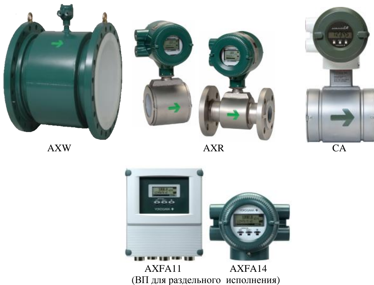
Фото 1. Фотографии внешнего вида модификаций счетчиков-расходомеров электромагнитных ADMAG (модификации AXF, AXR, CA, AXW) и вторичных преобразователей для раздельного исполнения

На рисунке 1 указаны места пломбировки от несанкционированного доступа и место размещения наклеек, в том числе о поверке.