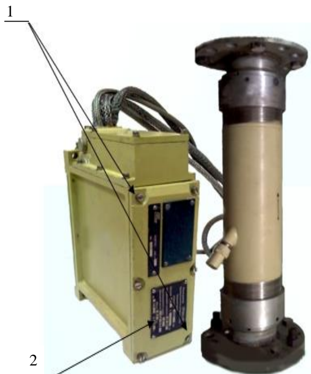
Рисунок 2- Внешний вид расходомера с преобразователем первичным угловым (ППУ)