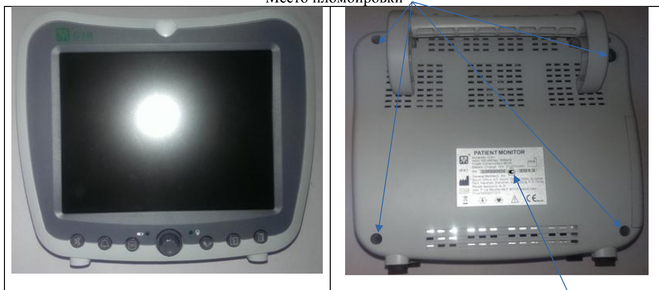
Рисунок 4 – Общий вид монитора пациента мультипараметрического модели G3H.