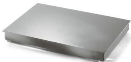
iL Economy 2000F/MP iL Economy 4000F/MP