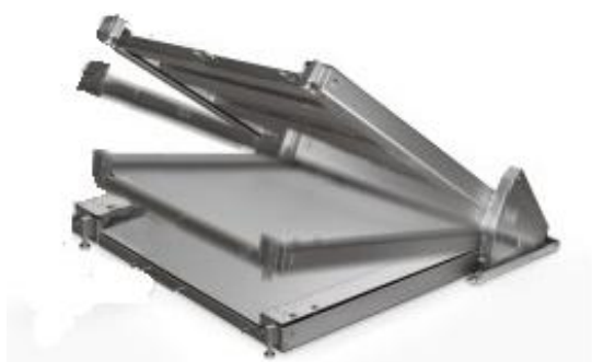
iL Special 2000FF/MP