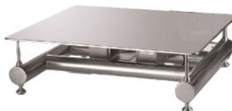
iL Professional 50SMP/SP, iL Professional 150SMP/SP