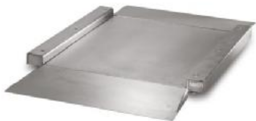
iL Special 750E/MP