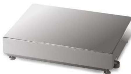
iL Professional 20F/HY, iL Professional 150F/HY, iL Professional 350F/HY, iL Professional 750F/HY