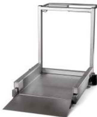
iL Special 750M/MP