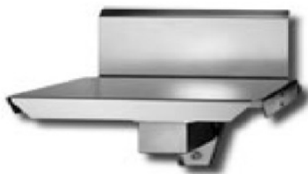
iL Special 150T/SP