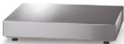
iL Economy 300F/SP