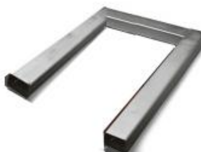
iL Special 3000U/MP