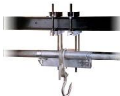
iL Special 1000OMP, iL Special 1000OR/MP, iL Special 400O/SP