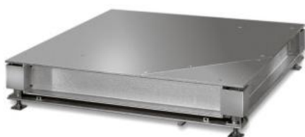
iL Professional 20000F/MP