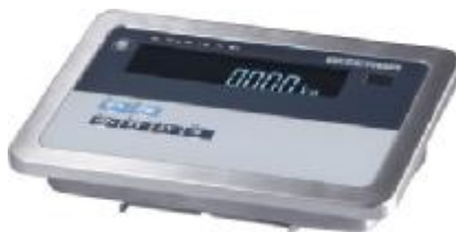
Рисунок 1 — Общий вид прибора eS10

Общий вид весоизмерительного прибора и ГПУ весов представлен на рисунках 1 – 3.