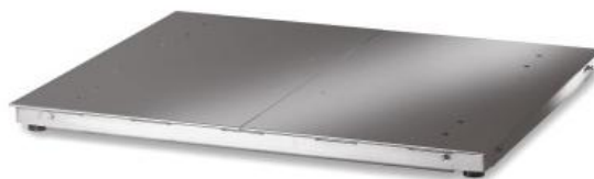
iL Professional 2000F/MP, iL Professional 4000F/MP, iL Professional 6000F/MP, iL Professional 7500F/MP