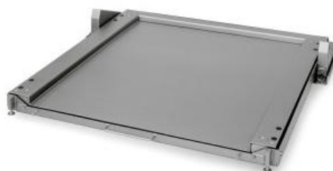
iL Special 4000D/MP