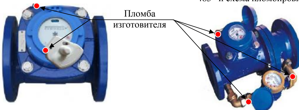
Рисунок 3 – Общий вид счетчиков исполнений Пульсар ТХХ 1 -Р 1) , Пульсар ТХХ 1 -Р 1) и схема пломбировки