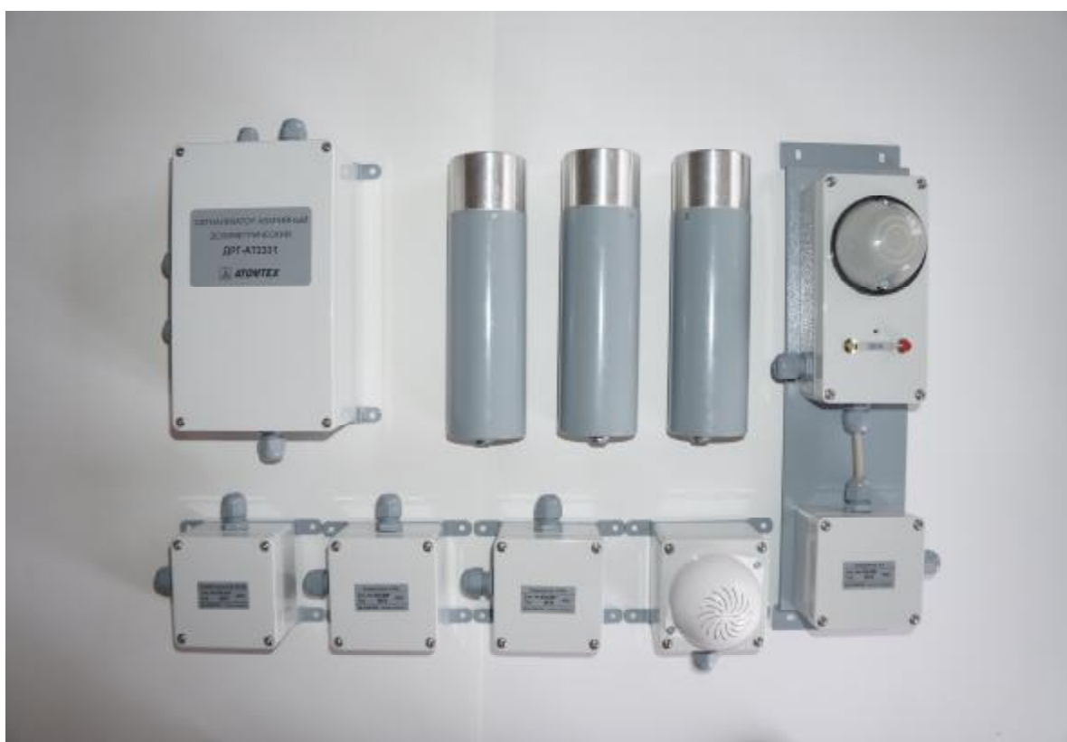
Рис. 1 – Общий вид сигнализатора аварийного дозиметрического ДРГ-АТ2331

Общий вид сигнализатора аварийного дозиметрического ДРГ-АТ2331 представлен на рисунке 1. Место пломбирования блока детектирования БДКГ-25 представлено на рисунке 2.