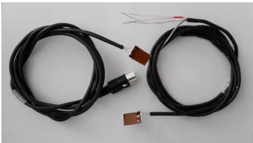
Рисунок 3 – термопреобразователи сопротивления ТСП 9715 в сборе