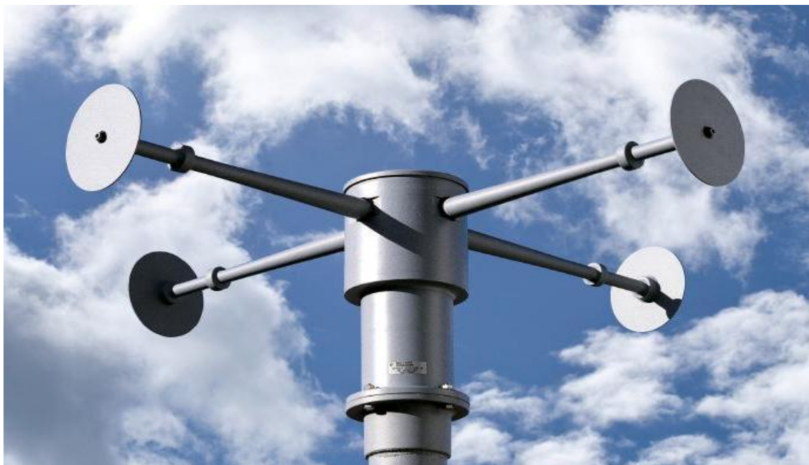
Рисунок 1 - Антенна всенаправленная активная R&S HE314A1 на мачте.

Внешний вид антенны представлен на рисунке 1.