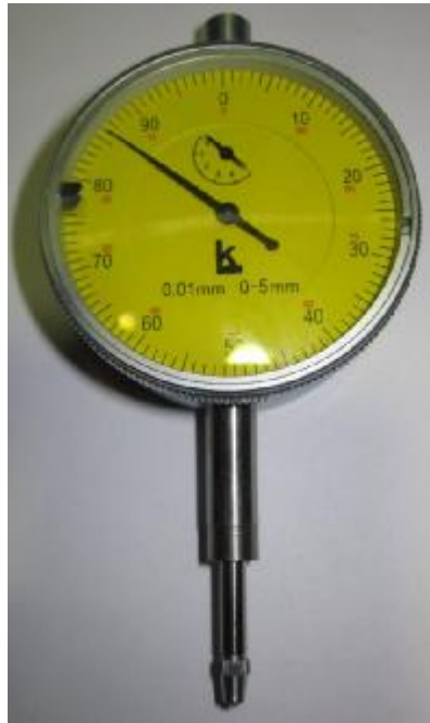
Рисунок 1 – Общий вид индикаторов ИЧ с желтым циферблатом и металлическим подвижным ободком.