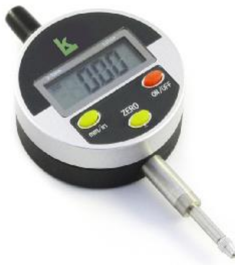
Рисунок 2 – Общий вид индикаторов ИЧЦ