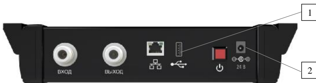
Рисунок 1 – Внешний вид анализаторов. Вид спереди