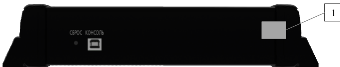
Рисунок 2 – Внешний вид анализаторов. Панель верхняя