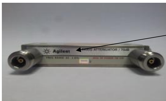
Рисунок 1. Общий вид аттенюатора 8494G