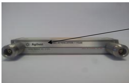
Рисунок 3. Общий вид аттенюатора 8495G с коаксиальным соединителем SMA