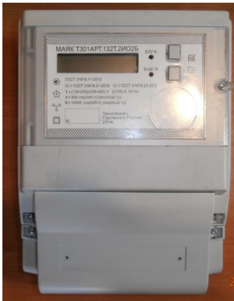
Рисунок 1 – Внешний вид счетчика с закрытой клеммной крышкой

Внешний вид счетчика МАЯК Т301АРТ с закрытой клеммной крышкой приведён на рисунке 1.