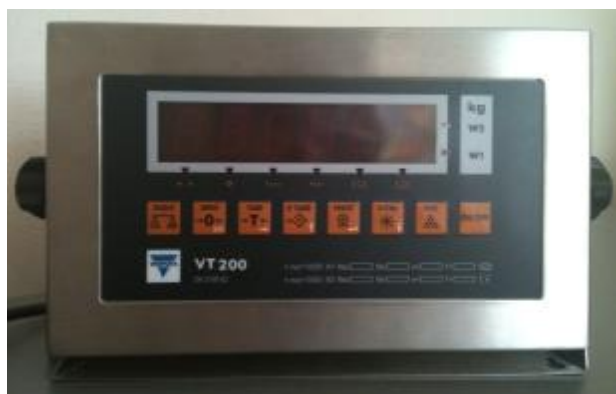
Рис.2с. Индикатор VT200