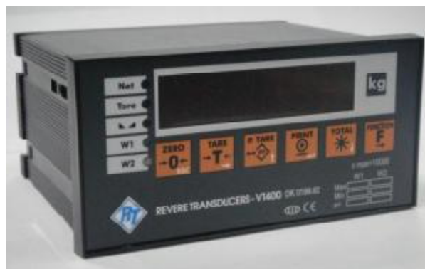
Рис.2д. Индикатор VT400