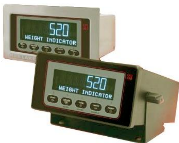
Рис.2а. Индикатор 520