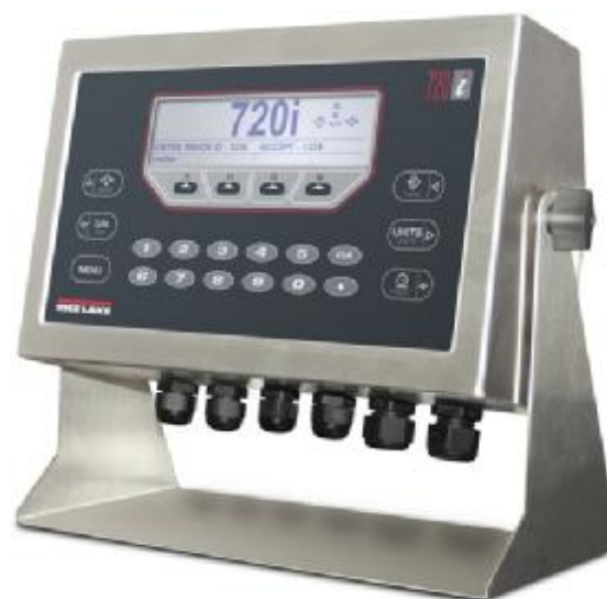
Рис.2б. Индикатор 720i