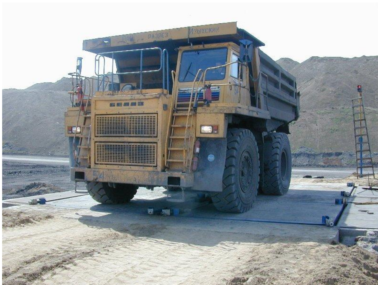
Рис.1. Весы МОСТ-Авто 150/300-ВМ14-720-4