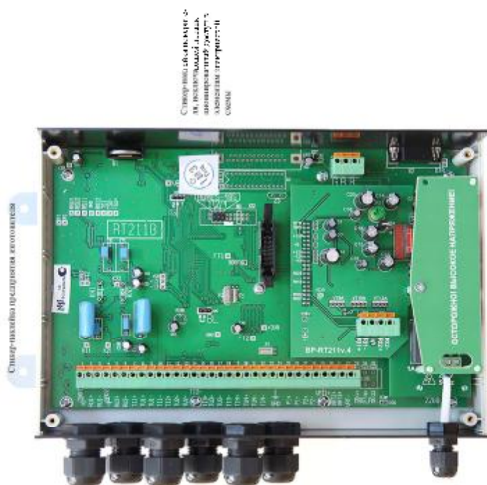
Место пломбирования регистраторов расхода Р приведено на рис.3.