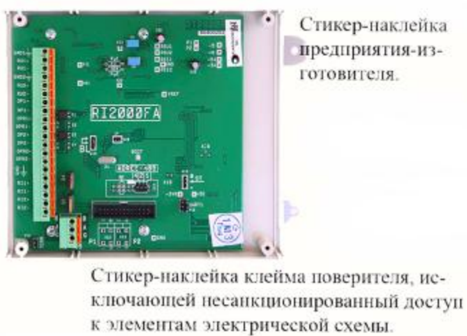
Место пломбирования теплосчетчиков без встроенных каналов ЭРК исполнений "А", "Д", "Е" и "Т" приведено на рис.4.