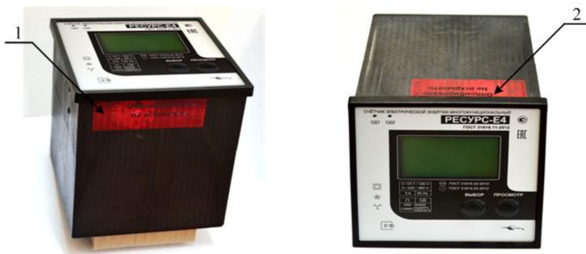
Рисунок 1 – Внешний вид и схема пломбирования счетчиков для навесного монтажа «Ресурс-Е4-Х-Х-н-Х»

Позиция 1 – место установки пломбы предприятия-изготовителя. Позиция 2 – место установки пломбы поверителя.