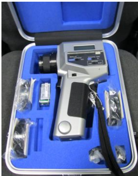
Рисунок 1 - Общий вид яркомера LS-110 в кейсе