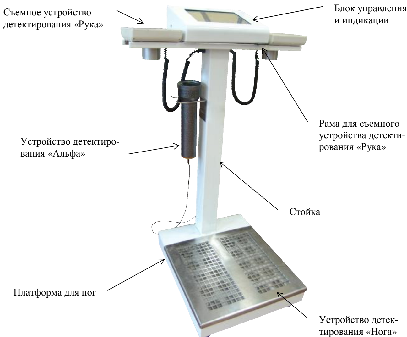
Рисунок 1.1 – Внешний вид установки МКС-100А «Чистотел»

Общий вид установки МКС-100А «Чистотел» представлен на Рисунке 1.