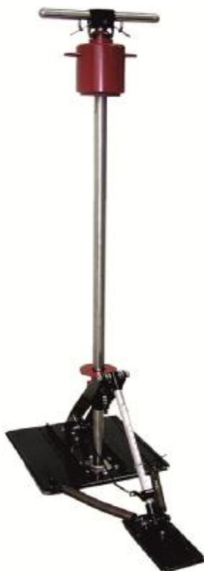
Рисунок 1 - Общий вид измерителя коэффициента сцепления портативного ИКСп-2М

Внешний вид измерителя представлен на рисунках 1, 2 и 3.