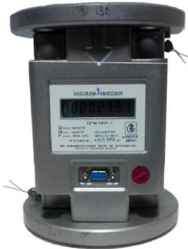
Рис. 2 Схема мест пломбировки