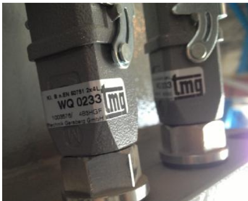
Рис.1 – Термопреобразователь сопротивления платиновый модели WQ0233 исполнения 1003576.

Внешний вид термопреобразователя представлен на рисунке 1.