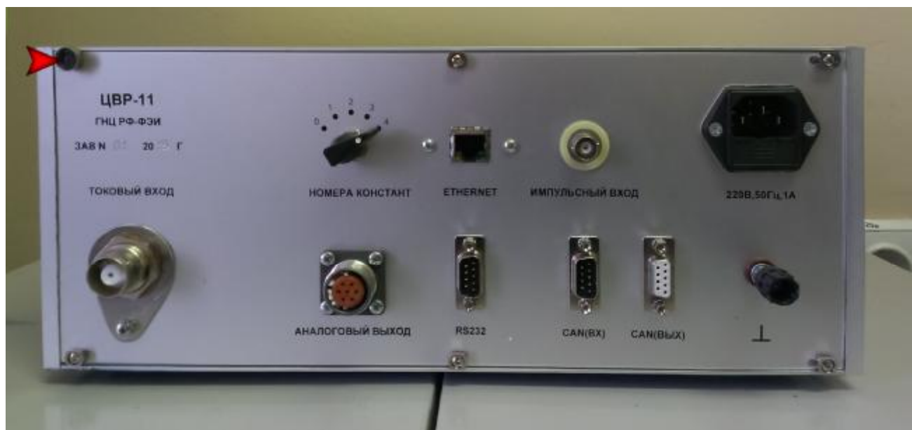
Рисунок 4 – Реактиметр ЦВР-11 вид сзади