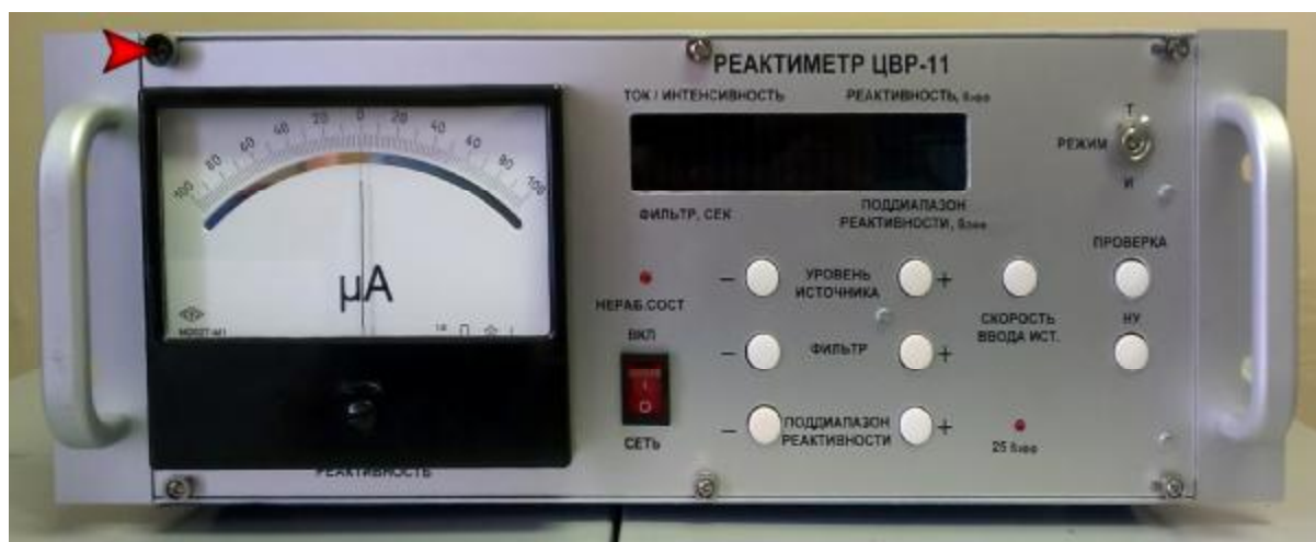
Рисунок 1 – Реактиметр ЦВР-11 вид спереди

Внешний вид реактиметра ЦВР-11 и места пломбировки в целях защиты от несанкционированного доступа представлены на рисунках 1-5. Места пломбировки показаны стрелками.