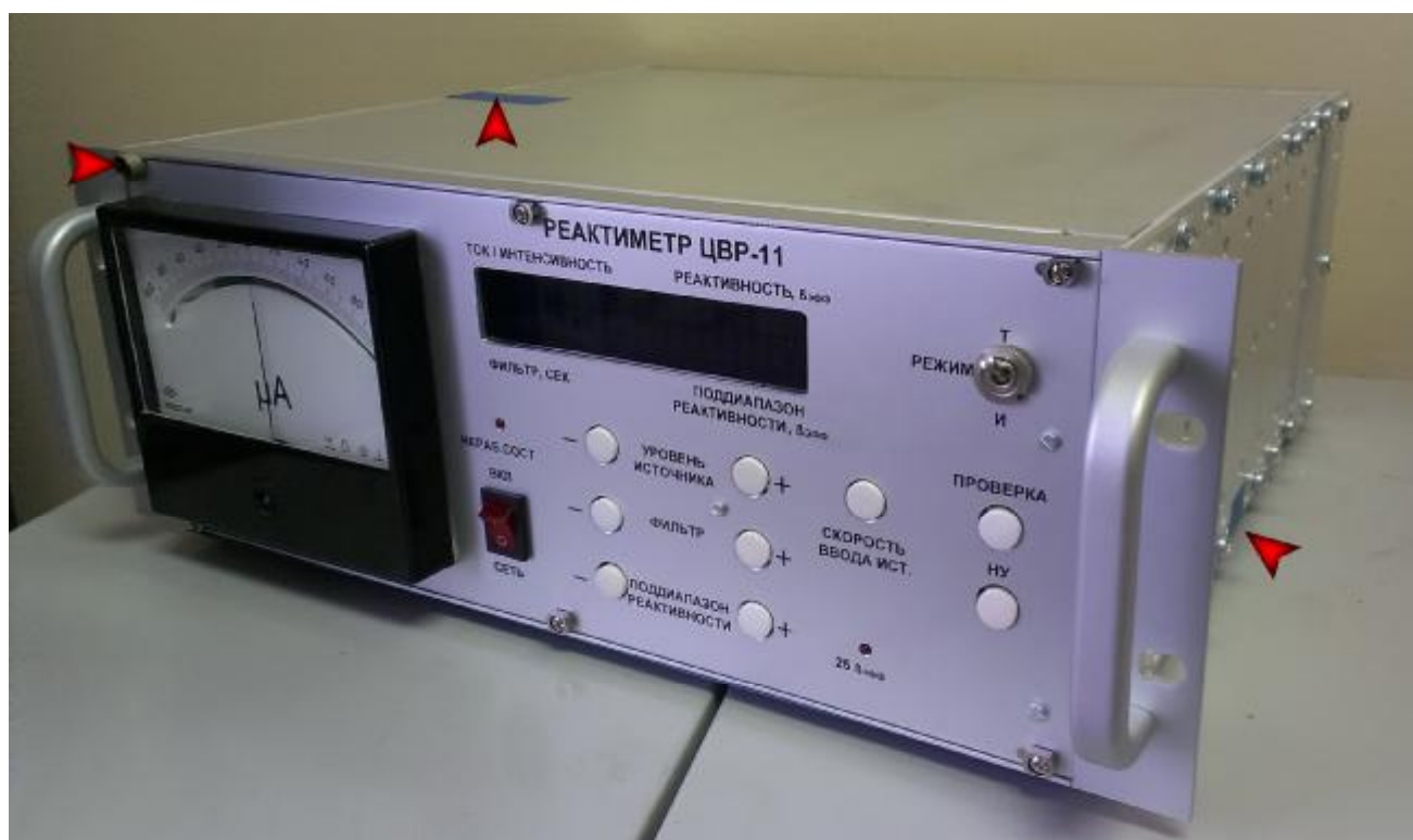
Рисунок 5 – Реактиметр ЦВР-11 общий вид