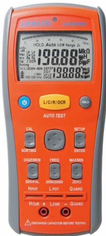
Рис. 1. Фотография общего вида измерителей LCR.

Фотография общего вида измерителей LCR представлена на рис. 1. Схема пломбировки от несанкционированного доступа изображена на рисунке 2.