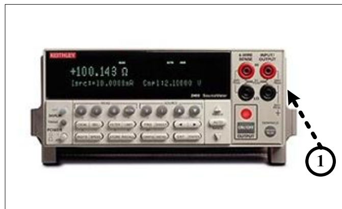
Примечание: ① - место для нанесения оттисков клейм или размещения наклеек Рисунок 2 – Калибраторы/мультиметры (модели 2400, 2410, 2430). Вид спереди