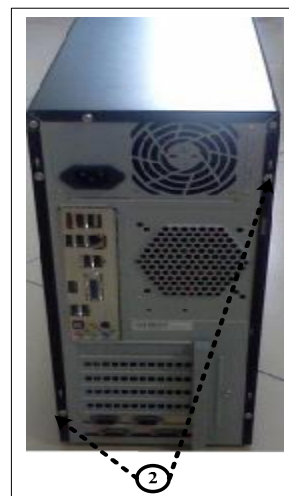
Примечание: ② - места пломбировки от несанкционированного доступа. Рисунок 5 – Управляющая ПЭВМ. Вид сзади