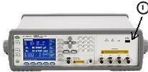
Примечание: ① - место для нанесения оттисков клейм или размещения наклеек Рисунок 4 – Измеритель RLC (модель E4980A). Вид спереди