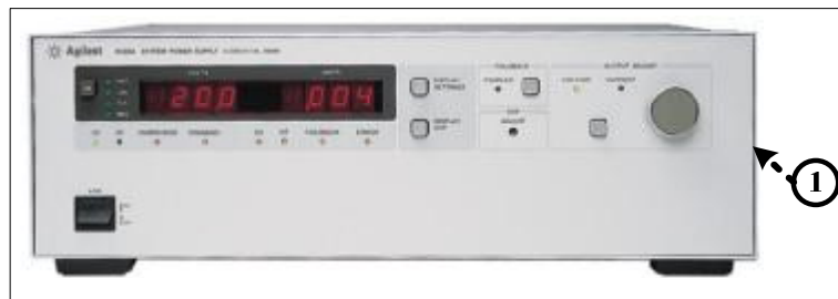
Примечание: ① - место для нанесения оттисков клейм или размещения наклеек Рисунок 3 – Источник питания (модель 6672A). Вид спереди