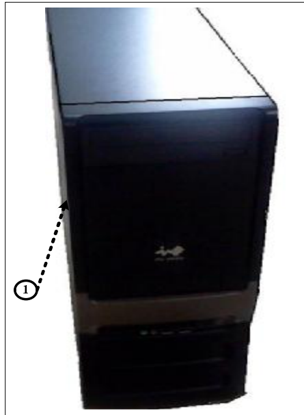
Примечание: ① - место для размещения наклеек Рисунок 1 – Управляющая ПЭВМ. Вид спереди