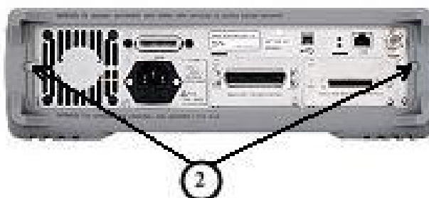
Примечание: ② - места пломбировки от несанкционированного доступа. Рисунок 8 – Измеритель RLC (модель E4980А). Вид сзади