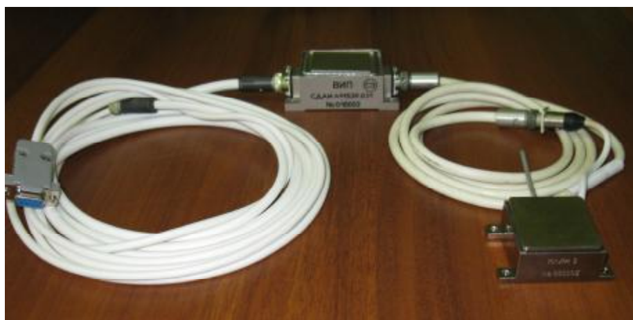
Рисунок 1 – Общий вид датчика КЛИН 3