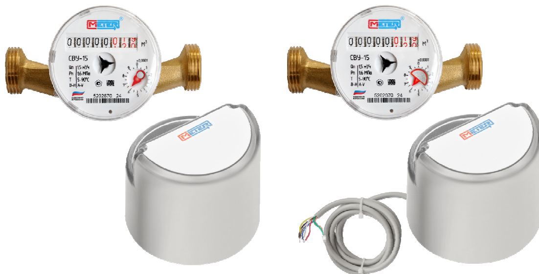
Рисунок 3 – Общий вид счетчика со съёмным датчиком импульсов

Заводской номер выполнен в цифровом формате, состоящий из 9 арабских цифр, первые две цифры из которых указывают год изготовления, наносится на циферблат счетчика.