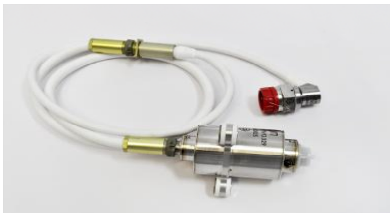
Рисунок 1 – Внешний вид датчика ДДВ 018

Общий вид датчик ДДВ 018 приведен на рисунке 1. Габаритно-установочные размеры приведены на рисунке 2. Схема пломбирования от несанкционированного доступа датчиков – на рисунке 3