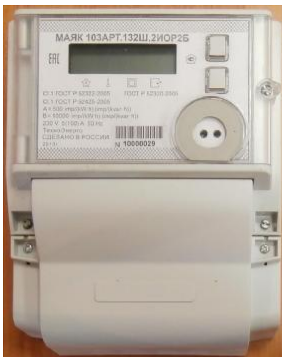
Рисунок 1 – Внешний вид счетчика

Внешний вид счетчика МАЯК 103АРТ приведён на рисунке 1.