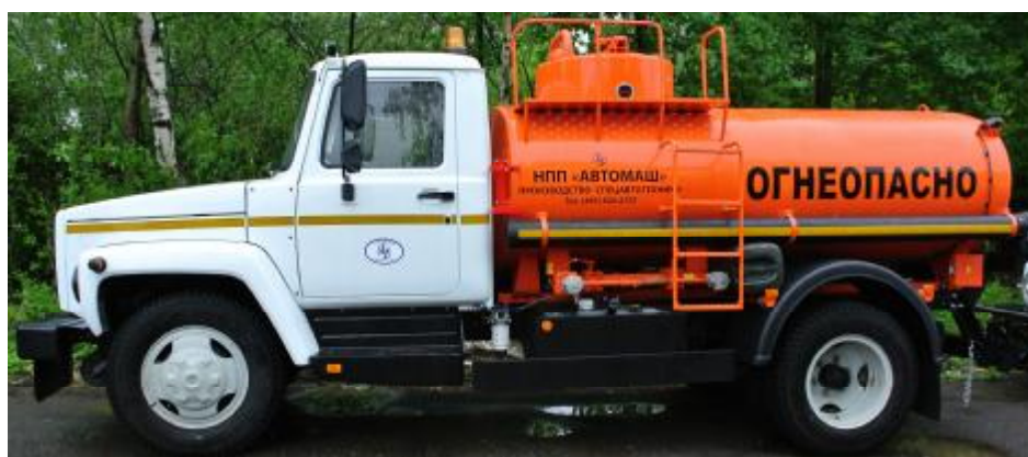
Фото 2. Общий вид автотопливозаправщика АТЗ-5,1 78570.

Фактическая вместимость каждого отсека указывается на алюминиевой табличке, приклепанной к горловине каждого отсека с правой стороны по ходу движения и удостоверяется оттиском поверительного клейма. На рисунке 1 приведено обозначение места расположения информационной таблички для нанесения оттиска поверительного клейма.