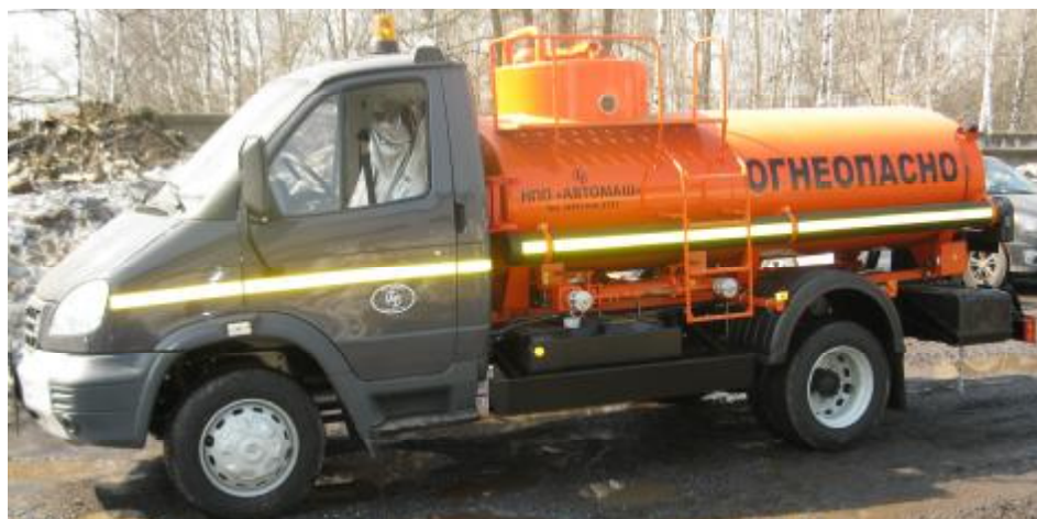
Фото 1. Общий вид автоцистерны АЦ-4,2 78570.