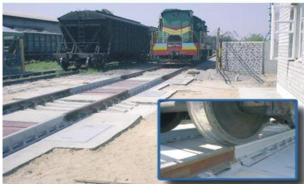
Рисунок 3- Общий вид весов неавтоматического действия (вагонных электронных весов) тип BSB