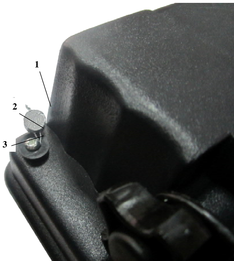
Рисунок 4.2 - Схема пломбировки ЭУ MERA V-3001