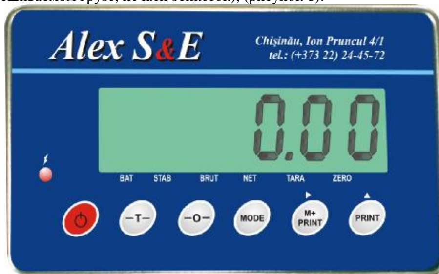
Рисунок 1- Внешний вид рабочей панели ЭУ MERAV-2000