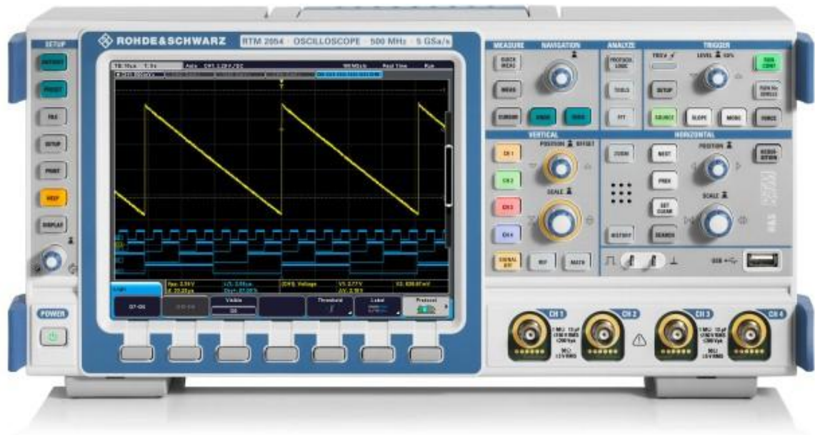
Рисунок 1. Фотография общего вида осциллографов цифровых запоминающих RTM2032, RTM2034, RTM2052, RTM2054

Схема пломбировки от несанкционированного доступа и обозначение мест для размещения наклеек приведены на рисунке 2.