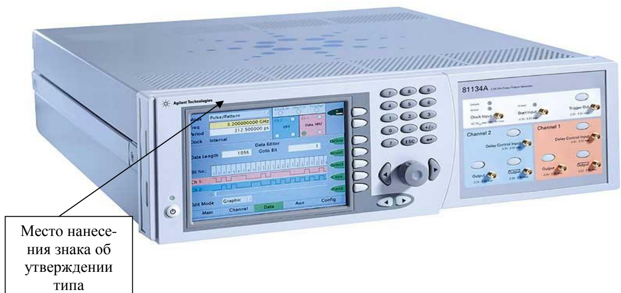
Рисунок 1 - Внешний вид генераторов

При оформлении внешнего вида генераторов могут использоваться логотипы компаний «Agilent Technologies» или «Keysight Technologies».