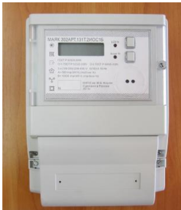
Рисунок 1 – Внешний вид счетчика с закрытой крышкой клеммной колодки

Внешний вид счетчика МАЯК 301АРТ с закрытой крышкой клеммной колодки приведен на рисунке 1. Схема опломбирования приведена на рисунке 2.