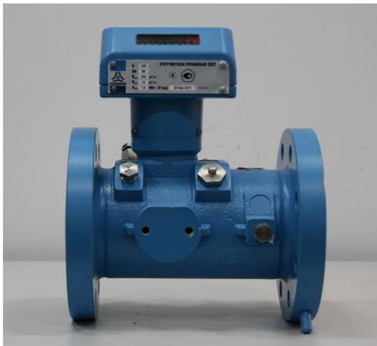
Фото 1. Общий вид счетчика турбинного CGT.

На фото 1 приведен общий вид счетчика газа турбинного CGT.