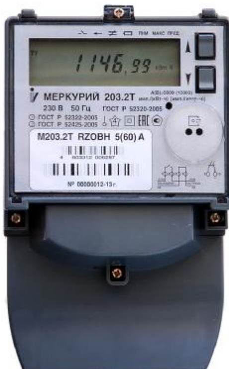
Рисунок 1 – Внешний вид счетчика с закрытой клеммной крышкой

На рисунке 1 приведена фотография общего вида счётчиков «Меркурий 203.2Т».