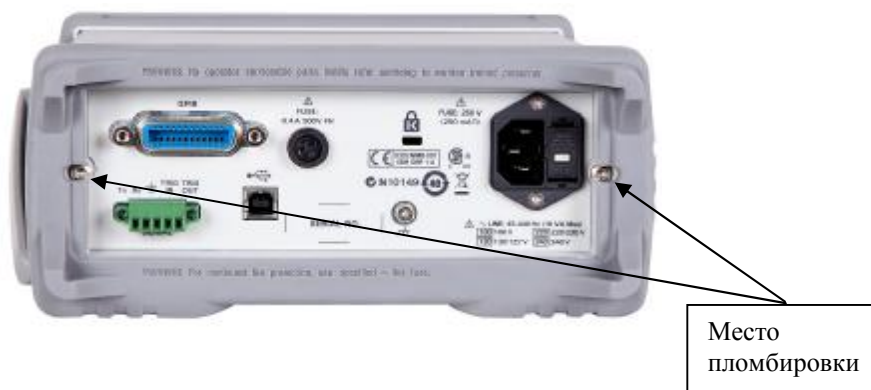
Рисунок 2 - Задняя панель мультиметров