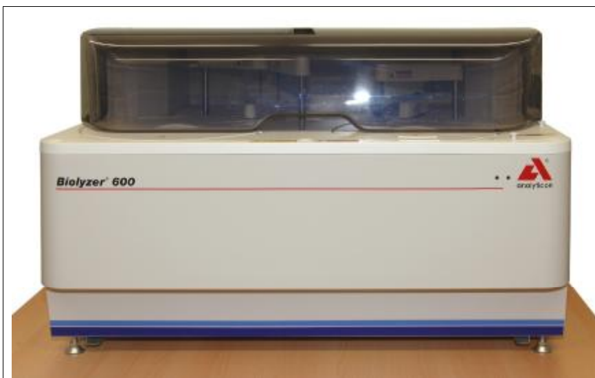
Рисунок 3 – Анализатор биохимический автоматический модели BIOLYZER 600