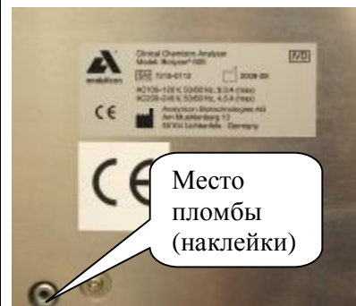
Рисунок 4 – Расположение пломбы (наклейки) Анализатор биохимический автоматический модели BIOLYZER 600