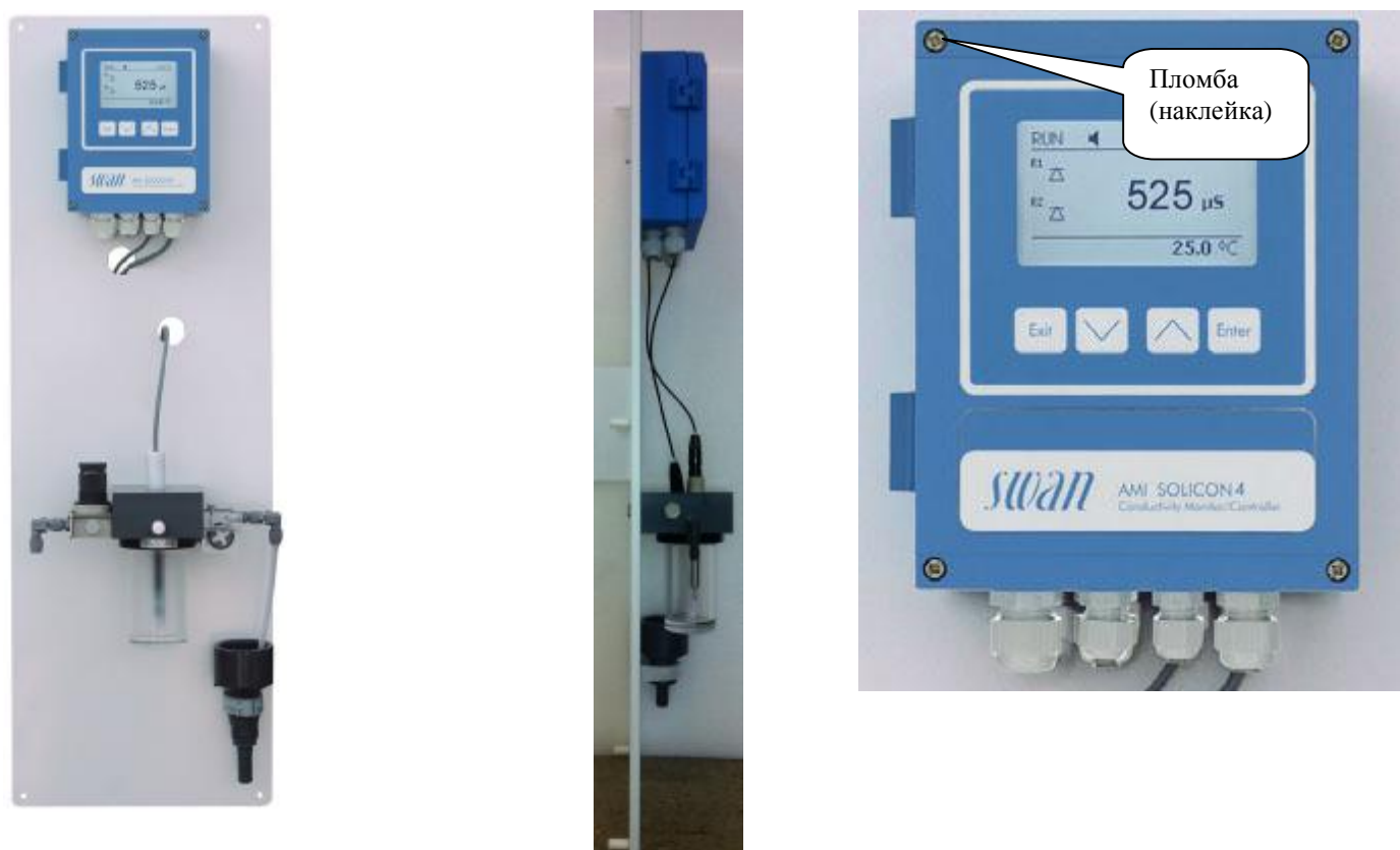
Рис. 6 Анализаторы жидкости кондуктометрические AMI модификаций AMI Solicon