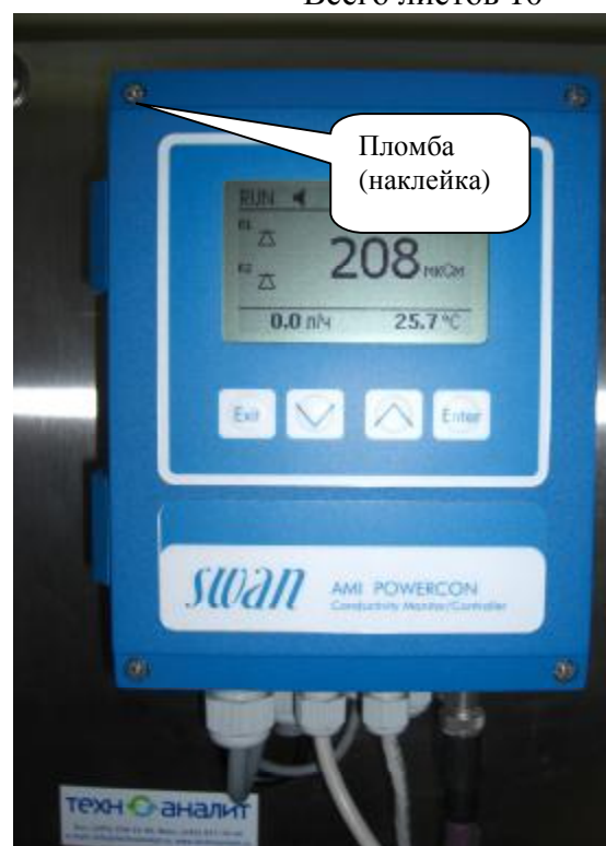
Рис. 3 Анализаторы жидкости кондуктометрические АМІ модификаций AMI Powercon Acid