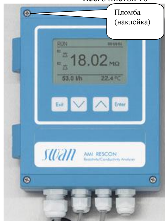
Рис. 1 Анализаторы жидкости кондуктометрические AMI модификаций AMI Rescon