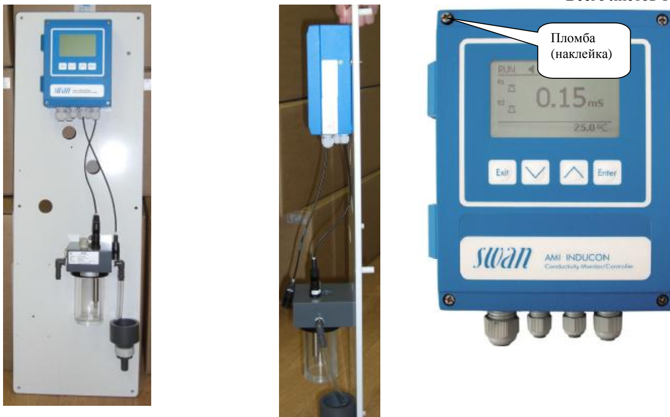
Рис. 7 Анализаторы жидкости кондуктометрические АМІ модификацій АМІ Inducon