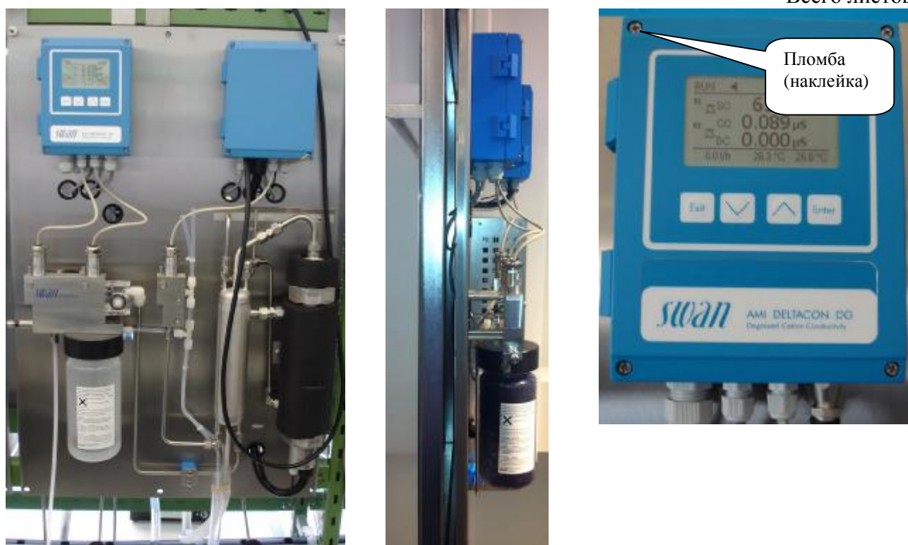
Рис.5 Анализаторы жидкости кондуктометрические AMI модификаций AMI Deltacon DG