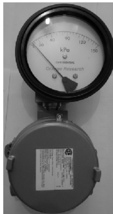
б) 1504 DGS, 1514 DGS