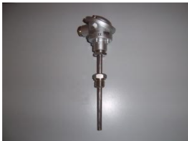
Рис.4. ТС модели 2хх