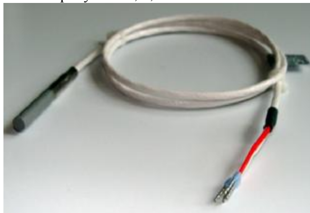
Рис.1. ТС модели 10K