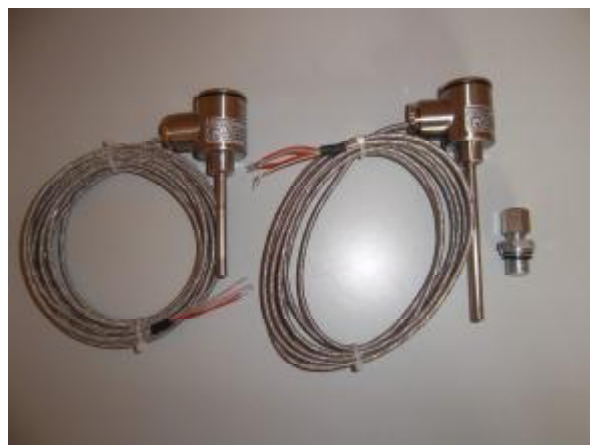
Рис.2. ТС моделей 2хх, Ех2хх