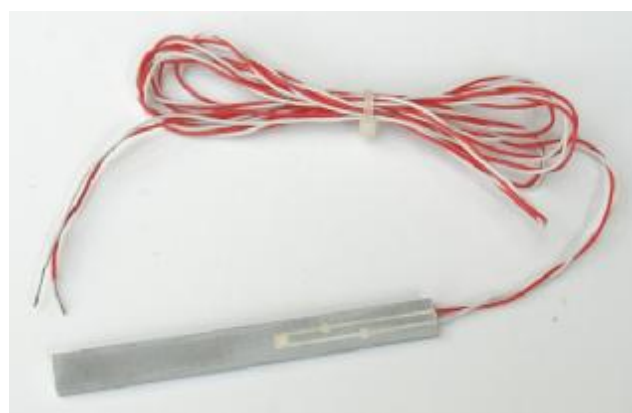
Рис.3. ТС модели ЕхNWT