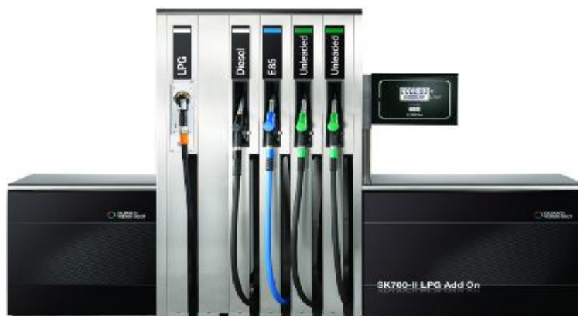
Р и с у н о к 1 – Колонки топливораздаточные комбинированные SK700-2+LPG.

Внешний вид колонок представлен на рисунке 1.