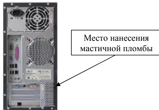
Рисунок 4 – Схема пломбировки ПК