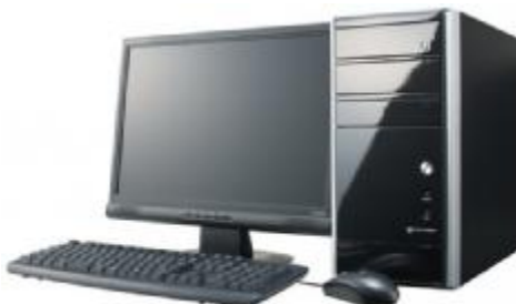
Рисунок 2 – Общий вид ПК

Принцип действия весов основан на преобразовании деформации взвешивающего рельса, возникающей под действием силы тяжести взвешиваемого железнодорожного транспортного средства, в аналоговый электрический сигнал, пропорциональный его массе. Далее этот сигнал передается в устройство обработки аналоговых данных, где преобразуется в цифровой код и обрабатывается. Измеренное значение массы выводится на дисплей ПК.