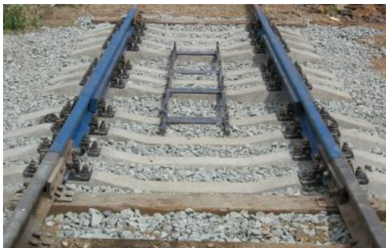
Рисунок 1 – Общий вид ГПУ