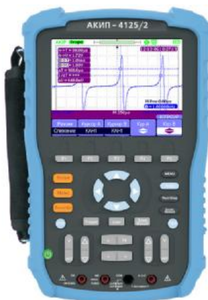
Рисунок 1. Фотография общего вида осциллографов-мультиметров

Фотография общего вида осциллографов-мультиметров представлена на рис. 1. Схема пломбировки от несанкционированного доступа изображена на рис. 2.