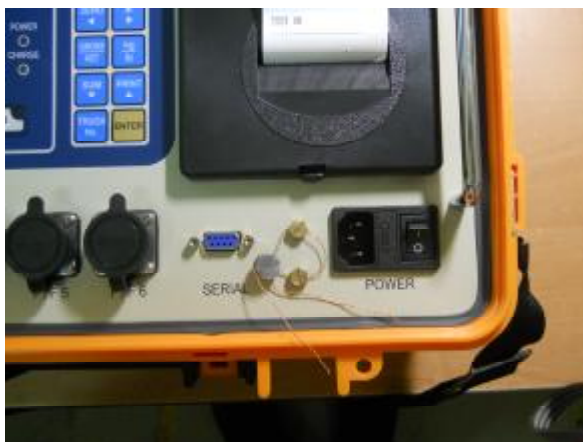
Рисунок 2 – Расположение защитной пломбы

Уровень защиты ПО от непреднамеренных и преднамеренных воздействий в соответствии с МИ 3286-2010 – «С». Защита от несанкционированного доступа к программному обеспечению обеспечивается установкой защитной пломбы на лицевой стороне весоизмерительного индикатора. Расположение защитной пломбы представлено на рисунке 2.