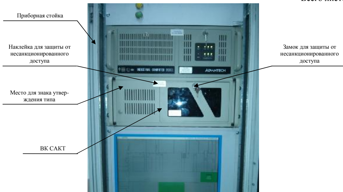
Рисунок 1 - Внешний вид ВК САКТ