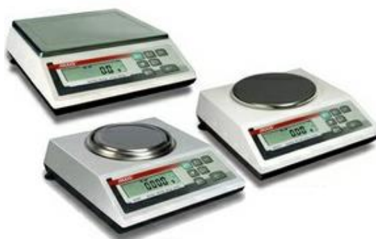
Рисунок 3 – Общий вид весов