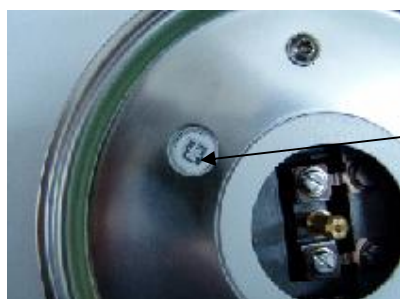
Рисунок 1 - Схема пломбирования весов от несанкционированного доступа

Пломбировка контрольной этикеткой винта стяжки корпуса