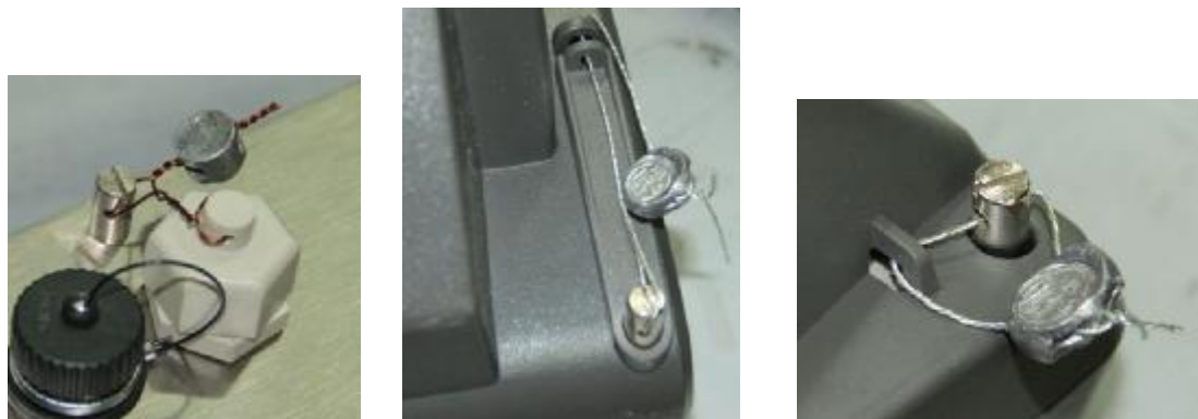
Рисунок 2 — Схема пломбировки весов от несанкционированного доступа

Знак поверки в виде наклейки наносится на лицевую панель индикатора. Схема пломбировки от несанкционированного доступа приведена на рисунке 2.