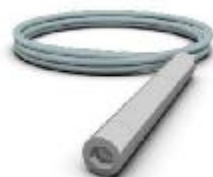
гидростатические датчики уровня с выходным сигналом 4-20мА