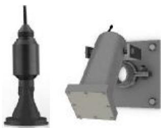
S30a - ультразвуковой радарный датчик скорости; SebaPuls - ультразвуковой радарный датчик уровня