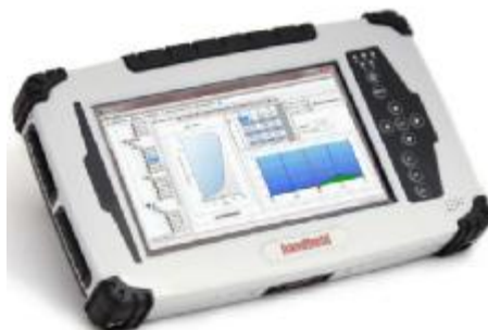
Планшетный ПК HDA-Pro