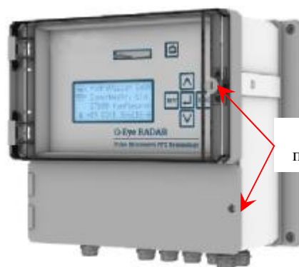
Q-Eye PSC Q-Eye Radar AquaProfiler MC