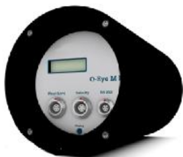
Q-Eye MII Q-Eye MII/GSM

В целях предотвращения доступа к узлам регулировки и настройки, а также к элементам конструкции, предусмотрены места пломбирования. Внешний вид расходомеров, датчиков и места пломбирования указаны на Рисунке 1.