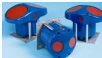
CM - погружной ультразвуковой датчик скорости с интегрированным гидростатическим датчиком уровня