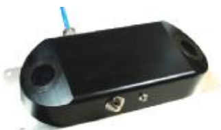
погружной ультразвуковой датчик скорости с интегрированным гидростатическим датчиком уровня