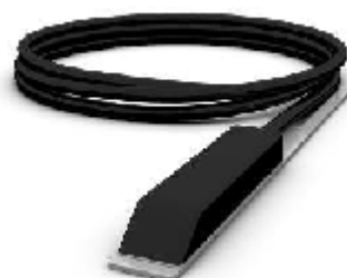
погружной ультразвуковой комбинированный датчик уровня- скорости