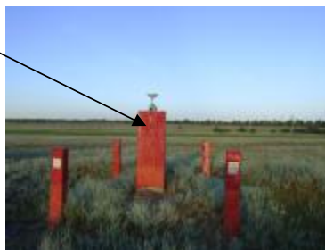
Рисунок 1 - Внешний вид пункта Базиса